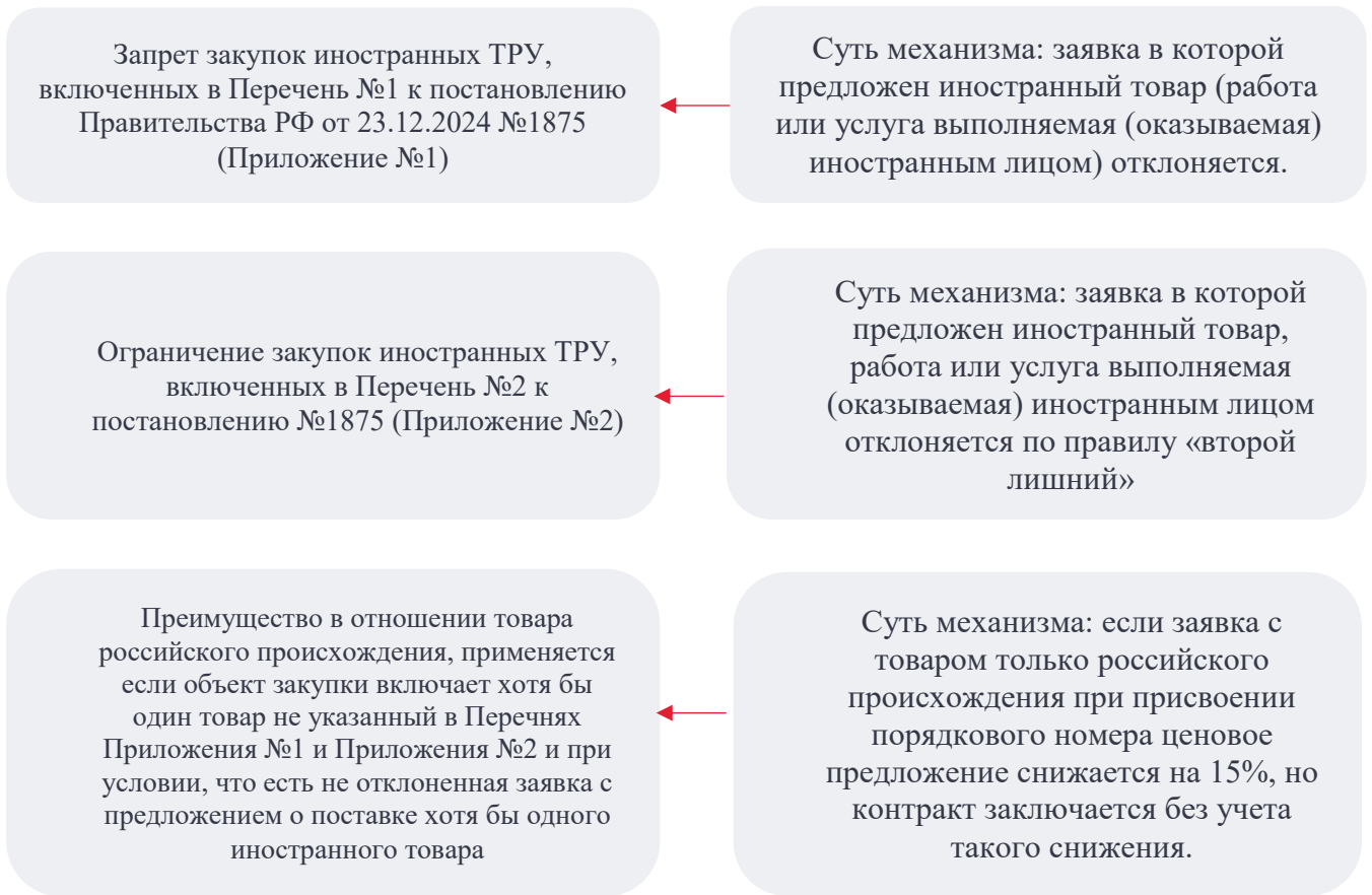
Рис. 1. Национальный режим с 01.01.2025

В соответствии с п. 4 Постановления № 1875 положения обозначенного акта, касающиеся товаров, работ и услуг (ТРУ) российского происхождения, применяются также в отношении ТРУ, происходящих из государств-членов Евразийского экономического союза (далее – ЕАЭС), то есть ТРУ из государств ЕАЭС предоставляются равные условия с ТРУ российского происхождения.