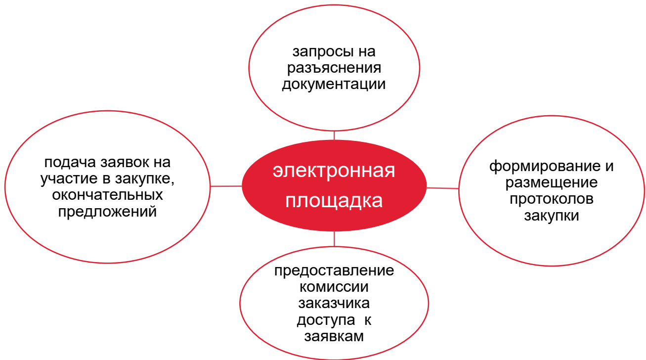
Рис. 2. Функционирование электронной площадки для целей проведения конкурентной закупки в электронной форме

Под оператором электронной площадки понимается являющееся коммерческой организацией юридическое лицо, созданное в соответствии с законодательством Российской Федерации в организационно-правовой форме общества с ограниченной ответственностью или непубличного акционерного общества, в уставном капитале которых доля иностранных граждан, лиц без гражданства, иностранных юридических лиц либо количество голосующих акций, которыми владеют указанные граждане и лица, составляет не более чем двадцать пять процентов, владеющее электронной площадкой, в том числе необходимыми для ее функционирования оборудованием и программно-техническими средствами и обеспечивающее проведение конкурентных закупок в электронной форме в соответствии с положениями Закона №223-ФЗ.